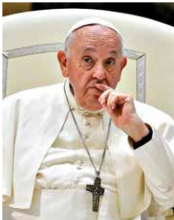
Las ideologías terminan siempre en dictaduras y buscan destruir a la familia

La intención del actual gobierno por implementar la nueva escuela mexicana ha provocado una serie de reacciones en los distintos sectores de la sociedad, principalmente con los padres de familia, originada por los nuevos libros de texto, programas y planes de estudio del nuevo modelo educativo, lo cual ha detonado una problemática social que ha agudizado una emergencia educativa en el país, estos materiales deberían impulsar el desarrollo integral de nuestros estudiantes, al margen de cualquier instrumentación ideológica o política, la educación es un derecho humano y no debe