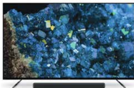
BRAVIA XR A80L OLED

Esta televisión cuenta con todos los servicios streaming, el sistema inteligente de Google TV y puede ser ideal para los videojuegos de PlayStation. Además, está disponible en 43, 50, 55, 75 y 85 pulgadas.