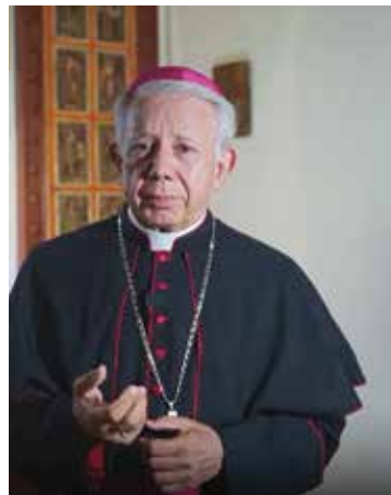
La educación es un derecho humano y no debe ser utilizada como instrumento de manipulación ideológica

1. Se violó la Constitución por no seguir el proceso que dicta el artículo tercero que señala, que el ejecutivo federal para determinar los principios rectores y los objetivos de la educación inicial, debe considerar la opinión de los gobiernos de las entidades federativas y de diversos actores sociales involucrados en la educación, tales como los padres de familia, asociaciones de maestros y expertos en los distintos temas.