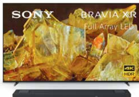
BRAVIA XR X90L FULLARRAY LED